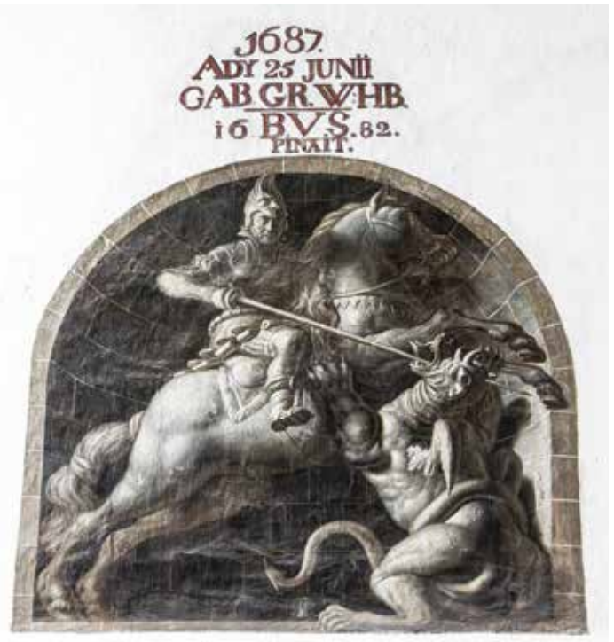
Boven de schildering staat een blok tekst.

Calvijn zou hebben gezegd dat kunst vooral niet mocht afleiden van de Schriftlezing en de prediking. Maar als kunst een boodschap uitstraalde die in overeenstemming was met het Woord van God, dan had hij geen bezwaren. De muurschildering in de Sint-Joriskerk verbeeldt de symbolische strijd tussen Christendom (Sint Joris) en antichrist (de draak), waarbij het Christendom overwint. Deze kunst met een boodschap mocht dus wel in een protestantse kerk.