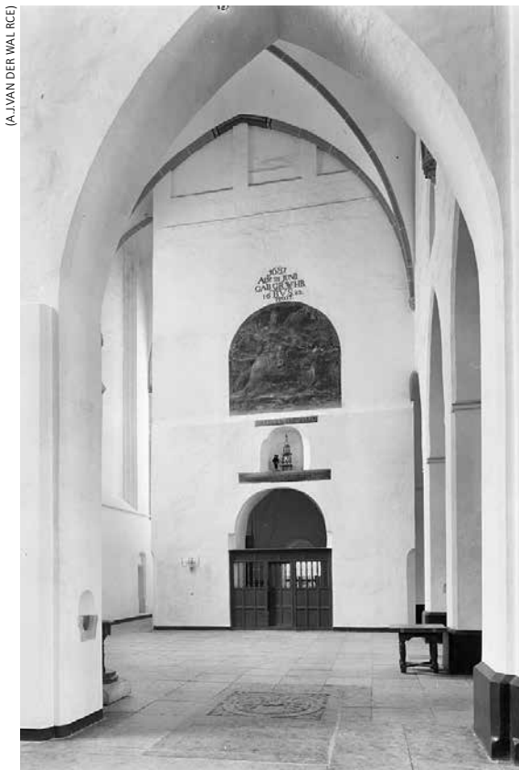
Muurschildering op de torenwand, binnen in de Sint-Joriskerk (1970).